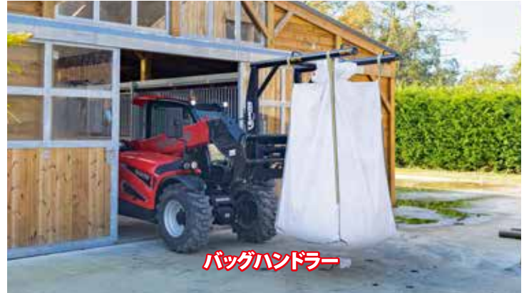
バッグハンドラー