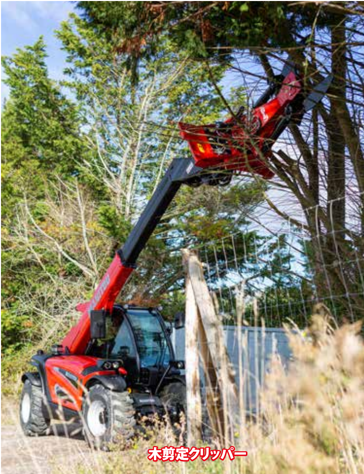
木剪定クリッパー